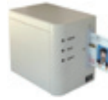
スキャナ式 免許証リーダー