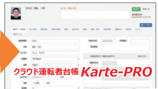
クラウド運転者台帳 Karte-PRO