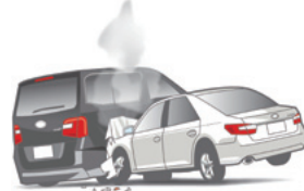
HITACHI ドライブシミュレーター ACM300