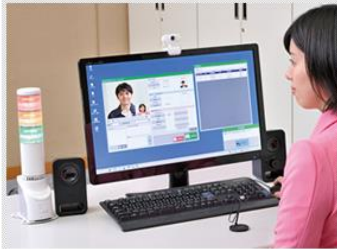
点呼執行者側システム