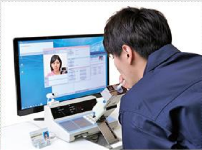
点呼測定者側システム

現在、輸送安全規則でも安全な点呼として認可されている、『IT点呼のシステム』を活用した新しい点呼形態をとれないだろうか。