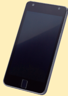
スマートフォン ※時期により対応機種が変わります。

(注意) ※携帯電話の対応機種は当社ホームページでご確認ください。※携帯電話はセットに含まれていません。