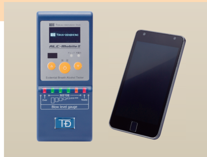
• 携帯電話の対応機種は当社ホームページでご確認ください

Bluetooth 接続でスマートフォン (Android) との連動が可能です。測定専用の Android アプリによって、顔写真付きのデータを送信することができます。音声ガイドや日本語表示で、操作がより分かりやすくなりました。また、圏外での測定や、携帯電話の電池切れ時でも、測定器本体に日時付き測定結果を保存しますので、後で確認する事が可能です。