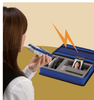
購入時期により、ケースが変更になる場合があります。

物流センター・宿泊先・パーキングエリア…いつ、どこにいても手軽に点検ができ、測定結果が自動的に管理者宛にメール送信されるので、常にリアルタイムの乗務員管理を実現。また自動送信により測定結果の改ざんも防止できます。