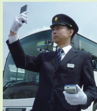
• 携帯電話の対応機種は当社ホームページでご確認ください

各営業所の測定、点呼の結果は クラウド型動画点呼システムで 点呼動画データはいつでも確認可能!