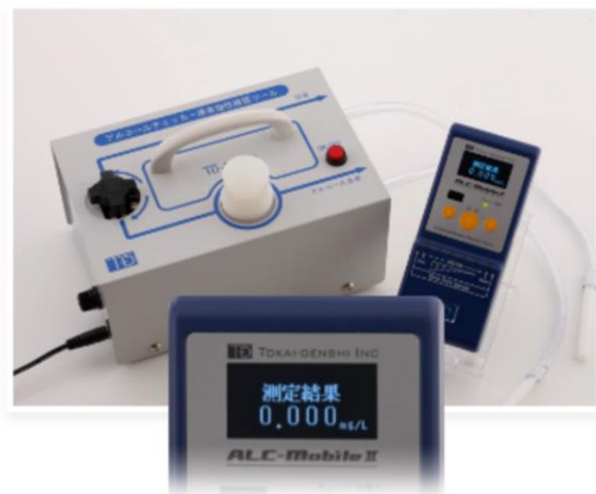
アルコールを含まない 「エアモード」