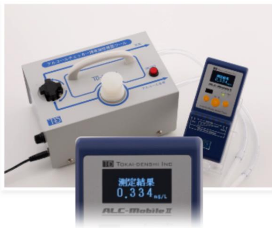
アルコールを含む 「アルコールモード」