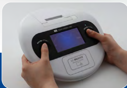
親指をセンサーに触れて 心拍数などを読み取る