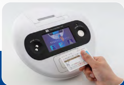
IC免許証で本人確認