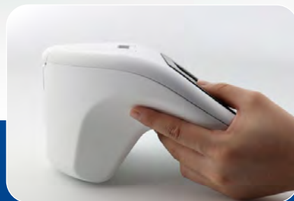
手のサイズに関わらず 安定した測定が可能