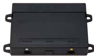
コントローラーユニット