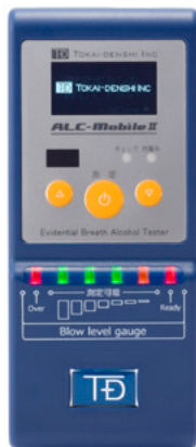
スマートフォン接続型 飲酒検査機 ALC-Mobile II