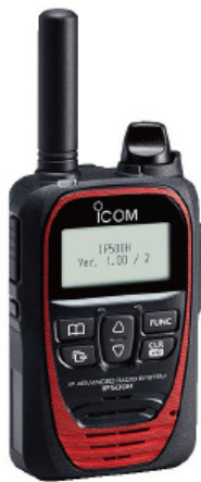
IP無線機 アイコム IP500H