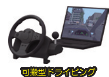
可搬型ドライビングシミュレーター