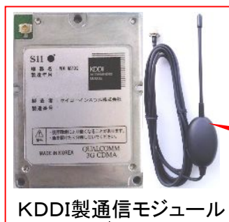
KDDI製通信モジュール