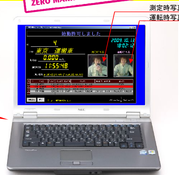
管理者側パソコン