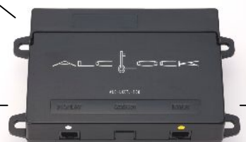
コントローラーユニット