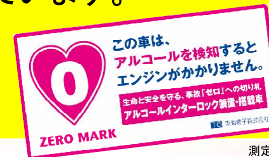
音声ガイダンス機能搭載

もう、夢の装置ではありません。インターロック搭載車が全国を走っています。東海電子製インターロック搭載車には、このステッカーが貼られています。