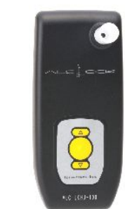
ハンディユニット