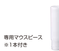
専用マウスピース ※1本付き