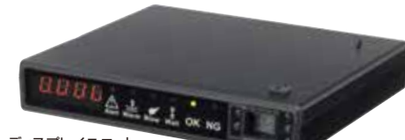
ディスプレイユニット (ZEROII)