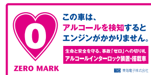
パンパーステッカー ※1枚