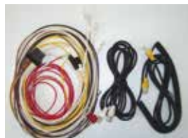
電源ケーブル・接続ケーブル