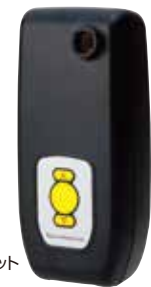
ハンディユニット