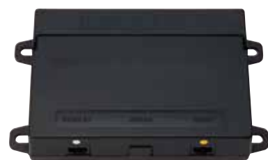
コントローラーユニット