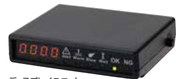
ディスプレイユニット (ZERO)